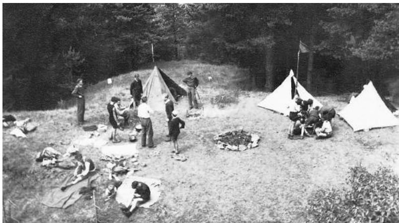
Na fotografii záběr z tábora ve Svojanově v červenci 1945.