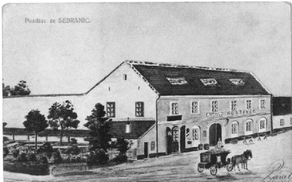
Pohlednice Vojtěcha Párala – Poštovní stanice na Vaculce (Sebranice), archiv Ing. Miroslav Kobelka.